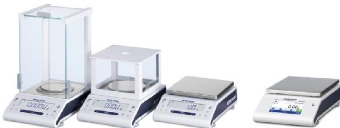
Рисунок 2 – Общий вид весов неавтоматического действия ML

Весы имеют следующие устройства и функции: