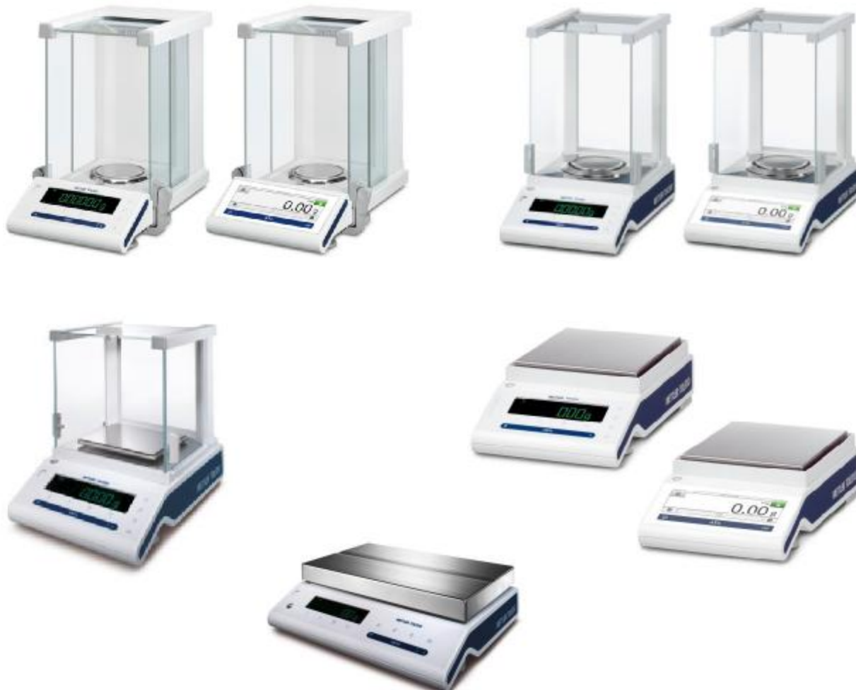
Рисунок 1 – Общий вид весов неавтоматического действия MS

Внешний вид весов показан на рисунках 1 и 2.